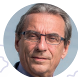
Roland Ries, Président de Cités Unies France

Depuis 2010, Cités Unies France propose un évènement annuel aussi fédérateur qu'incontournable dans le monde de la coopération décentralisée, décrit comme « le Davos de l'action internationale des collectivités territoriales » par la Présidence de la République lors de la venue du Président François Hollande en 2015.